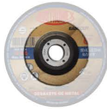
Aprovechamiento máximo con esmeriladora de 7"