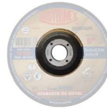
Aprovechamiento máximo con esmeriladora de 6"